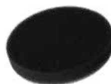
AbraClean 150 x 25 mm Moyen