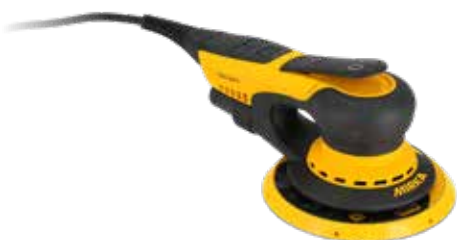
Mirka® DEROS II 650 150 mm

Compatible avec Mirka® DEROS II 650 et Mirka® AIROS 650S pour un flux de travail plus fluide.