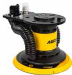
Mirka® AIROS 650S 150 mm